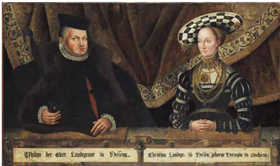
▼ Супруги Филипп Гессенский (1504–1567) и Кристина Саксонская (1505–1549)

КРИСТИНА РОДИЛА СУПРУГУ ДЕВЯТЬ ДЕТЕЙ. ТЕМ НЕ МЕНЕЕ ФИЛИПП УТВЕРЖДАЛ, ЧТО НИКОГДА НЕ ИСПЫТЫВАЛ НИКАКИХ ЧУВСТВ К ЖЕНЕ, КОТОРАЯ, ПО ЕГО СЛОВАМ, БЫЛА НЕПРИВЕТЛИВА, ЧЕРСТВА, УРОДЛИВА И ДУРНО ПАХЛА.