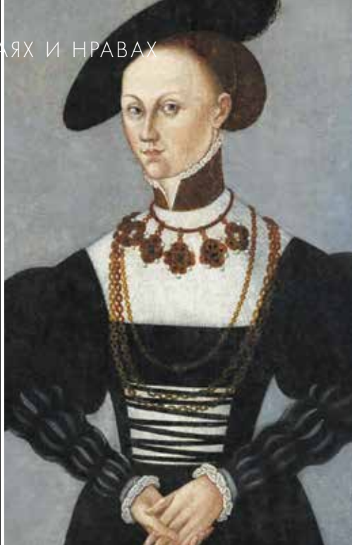
▲ Маргарита фон дер Заале (1522–1566) – вторая (морганатическая) жена Филиппа Гессенского

следствии доживших до взрослого возраста и вступивших в брак (надо сказать, что это отличная выживаемость детей по тем временам!).