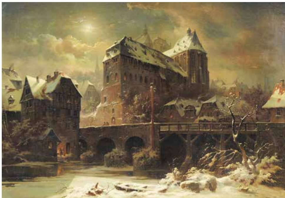
► Гессенский Марбург, где родился ландграф Филипп

Только Лютер поставил условие держать этот брак в тайне, иначе, « чего доброго, любой, вплоть до неотесанного крестьянина, решит, что и у него есть право просить такое разрешение ».