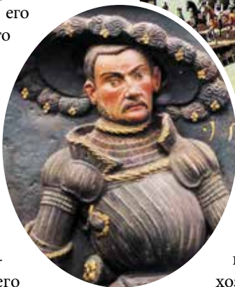
▲ Гессенский город Кассель. Даже после смерти Кристины второй жене Филиппа было запрещено проживать в местном ландграфском замке.

Ни один из девяти его детей от Кристины (младшему на момент смерти матери было два года) так и не признал