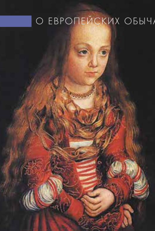
▲ Предположительно Кристина Саксонская в детстве. Портрет кисти Кранаха. Ок. 1517