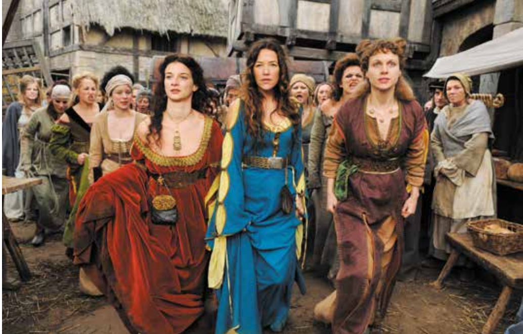
▲ Кадр из немецкого фильма «Странствующая блудница» о ремесле жриц любви в Средние века

Сохранившиеся в архивах акты по аристократическим разводам, аннулированию браков (или попыткам) в Средние века и в Новое время переполнены подобными очернениями надоевших жен со стороны их супругов. Вряд ли следует безоговорочно верить указанным в жалобах фактам. Особенно сомнительны высказывания о дурном запахе от супруги. Миф о недостаточной гигиене тела в прошлые века довольно распространен, но не является доказательством того, что женщины-аристократки были нечистоплотны. (А, может, речь шла о несвежем дыхании?) Но как бы то ни было, подобные жалобы обычно возникали тогда, когда от жены хотели избавиться, а новая кандидатура на ее роль уже была найдена (ну или вот-вот будет найдена). Вспомним, что и английский король Генрих VIII жаловался на дурной запах от своей четвертой жены Анны Клевской. И Людовик XII в 1498 году, добиваясь у Папы развода с Жанной Французской, тоже упоминал, что, помимо инвалидности и бесплодия, его жена неприятно пахла.