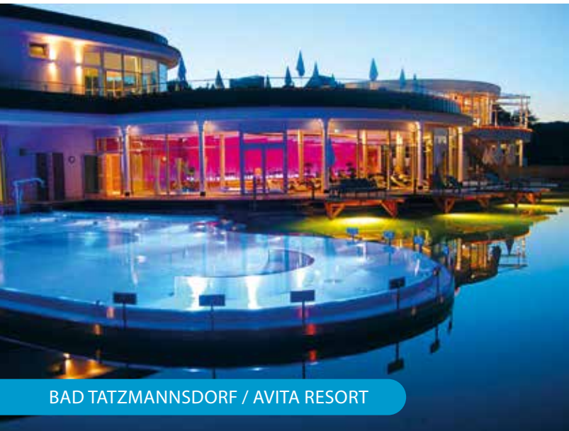
BAD TATZMANNSDORF / AVITA RESORT