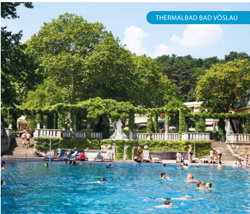
THERMALBAD BAD VÖSLAU