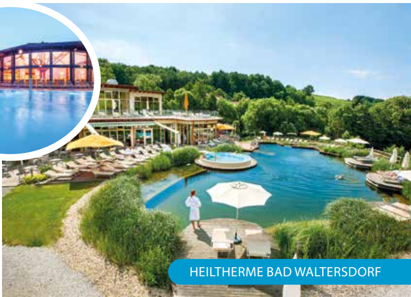
HEILTHERME BAD WALTERSDORF