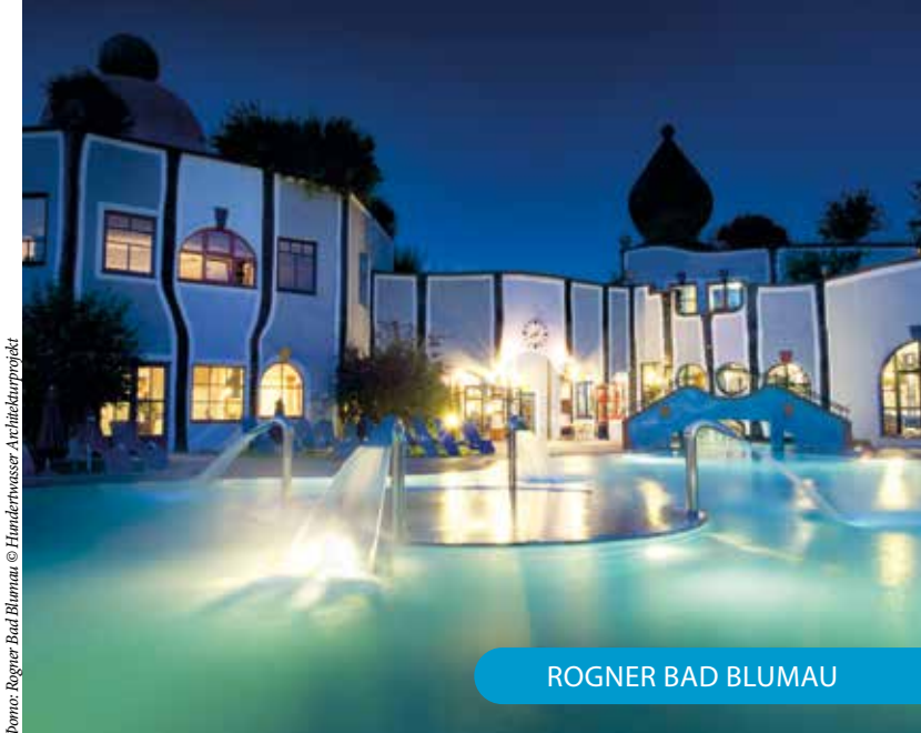
Фото: Rogner Bad Blumau © Hunderwasser Architekturprojekt

По материалам из открытых источников Диана Мамедова