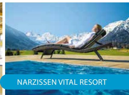
NARZISSEN VITAL RESORT