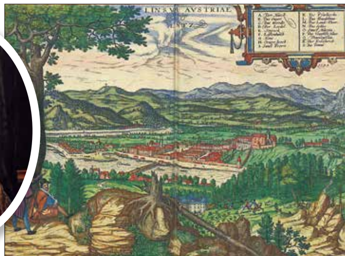
▲ Линц в 1594 году.

Линц город был впервые упомянут в 799 году в связи со строительством храма Святого Мартина, старейшей из сохранившихся церквей Австрии. Короткое, энергичное название гармонирует с современным, активно развивающимся городом, хотя предыдущие – Лентос и Ленция – были благозвучнее.