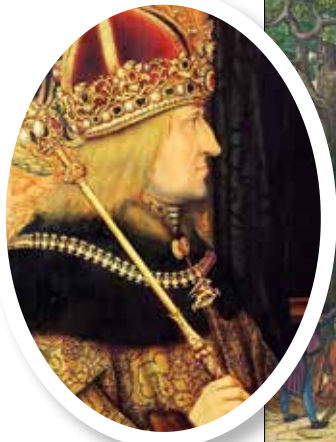
▲ Император Фридрих III.