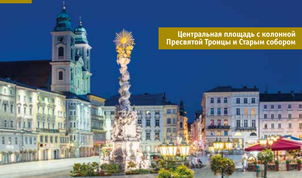
Центральная площадь с колонной Пресвятой Троицы и Старым собором