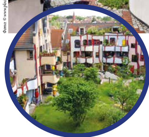
▲ «Жилье под дождевой башней» в Плохингене

В «Зеленой цитадели» 55 квартир площадью 50–145 кв. м. И у всех них разная планировка.