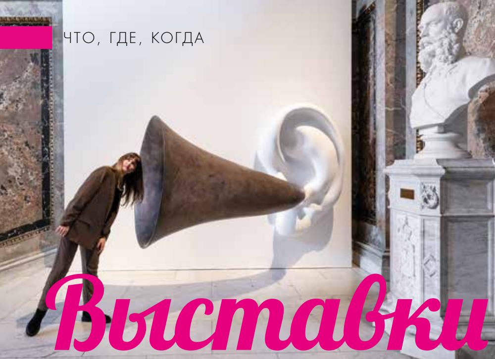
© John Baldessari. Courtesy of the artist, Sprinth Magers and Beyer Projects / Foto: KHM-Museumsverband