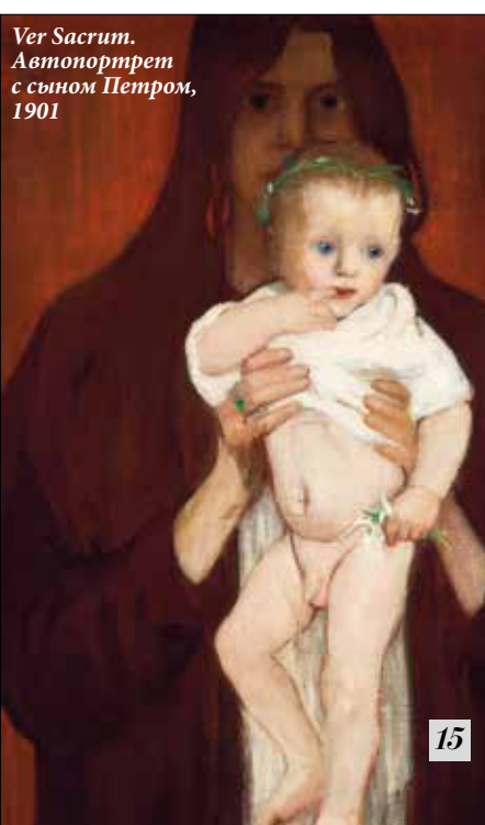
Ver Sacrum. Автопортрет с сыном Петром, 1901