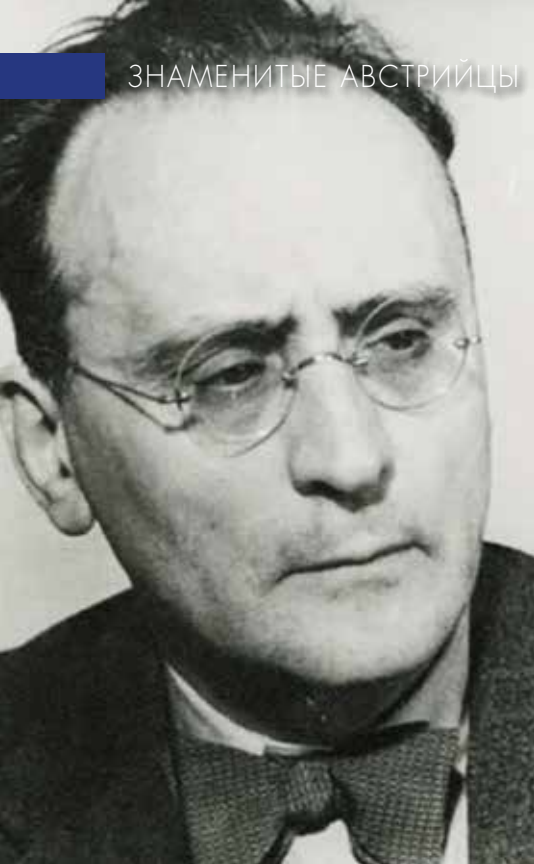
▲ Антон фон Веберн (1883 – 1945).