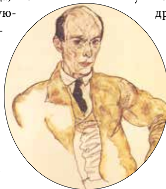
▲ Портрет Арнольда Шёнберга, написанный Эгоном Шиле в 1917 году.

В 1909 году начался первый период его творчества как композитора – время так называемой свободной атональности: он написал Пять