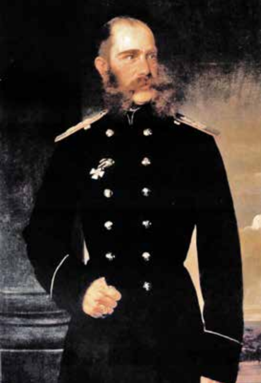
▲ Франц Иосиф I в сюртуке шефа русского Кексгольмского полка. Портрет работы Г. фон Ангели (1874 г.)

Позднее, в 1850 году, молодой монарх приехал к царю Николаю в гости в Варшаву, чтобы поблагодарить за поддержку в подавлении мятежа. Русский император по-отечески общался с Францем Иосифом, называя его на французском языке « MON FILS » (мой сын).