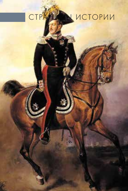
▲ Портрет императора Николая I на коне. Худ. В. Тимм

ей. В этот самый сложный период послом России в Вене был знаменитый министр иностранных дел, а затем канцлер России А. М. Горчаков.