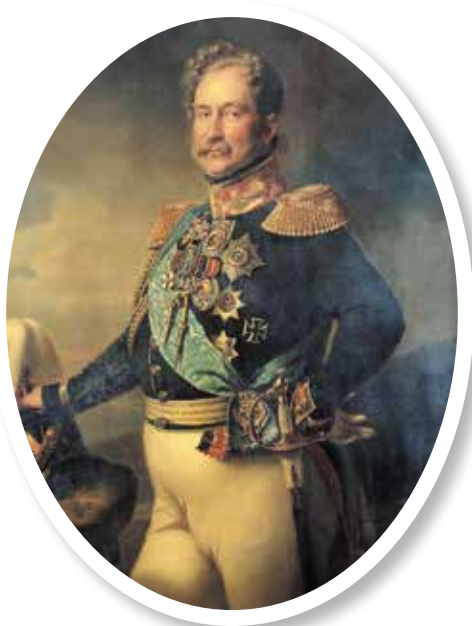
▲ Князь А. Ф. Орлов

Орлова приняли в Вене с внешним почетом. В переговорах участвовала вся верхушка генералитета, главные советни-