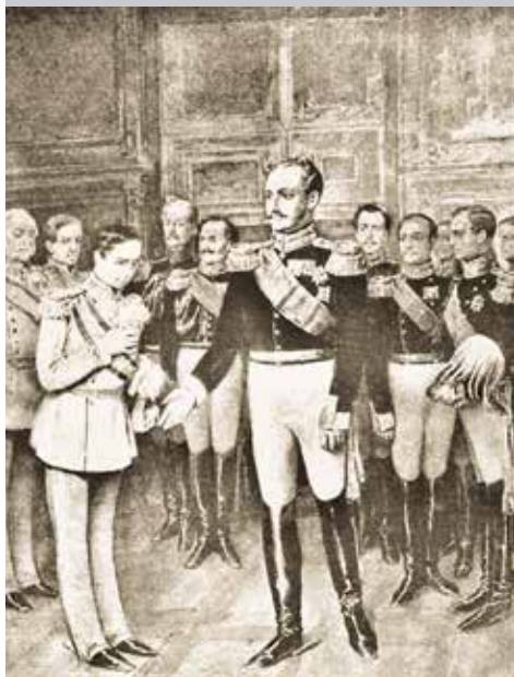
▼ Встреча Николая I и Франца Иосифа в 1850 г. в Варшаве