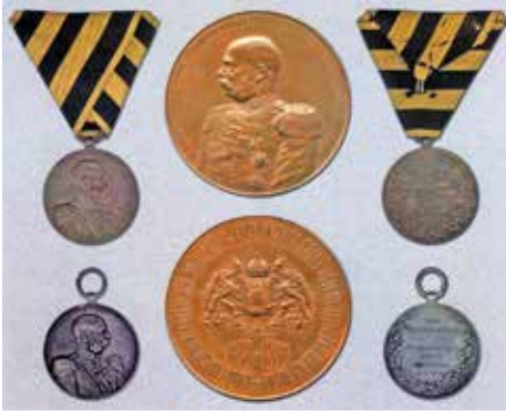
▲ Австрийская медаль по случаю 50-летия шефства Франца Иосифа в Кексгольмском полку, 1898 г.