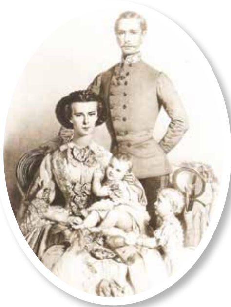
▲ Франц Иосиф с супругой Елизаветой Баварской (Сисси) и детьми

Незадолго до этого, в ходе очередной встречи в чешском Рейхштадте в 1876 году, Франц Иосиф дал обещание русскому царю соблюдать благожелательный нейтралитет в случае русско-турецкой войны при условии, что Рос-