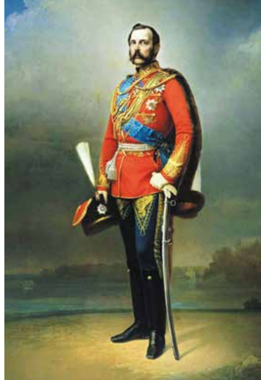
▲ Александр II – российский император, правивший Россией с 1855 по 1881 год

Усиление панславистских настроений среди подданных Габсбургов на Балканах и в Галиции воспринималось в Вене с большой тревогой. Возможность образования на Балканах крупного самостоятельного славянского государства, дружественного России, расценивалось как «кошмар» . Поэтому Франц Иосиф в то время склонялся к поддержке дряхлевшей Османской им-