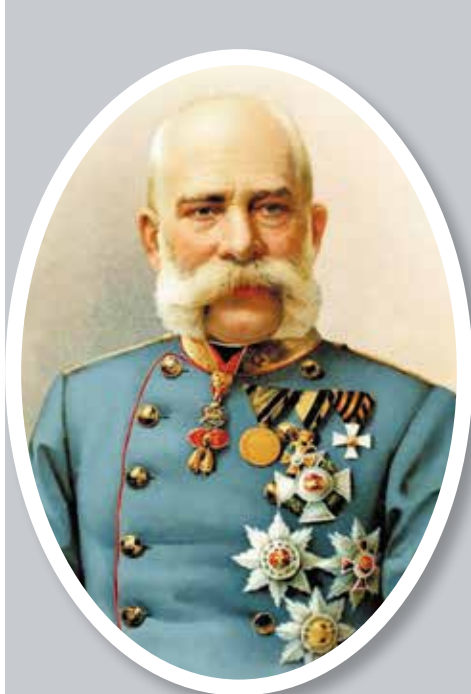
▲ Император Австро-Венгрии Франц Иосиф I с российским орденом Святого Георгия (белый крест с георгиевской лентой)

Как отмечал известный отечественный историк Е. В. Тарле, царь Николай спас в 1849 году Франца Иосифа