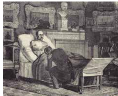
▼ Император Николай I благословляет сына Александра на царство. Худ. В. Тимм

В феврале 1855 года вследствие охлаждения на военном смотре Николай I скончался. На его похороны Франц Иосиф послал эрцгерцога Вильгельма. Царившие тогда общественные настроения в России эмоционально выразил Ф. И. Тютчев в стихотворении «По случаю приезда австрийского эрцгерцога на похороны императора Николая»: «Прочь, прочь австрийского Иуду от гробовой его доски!».