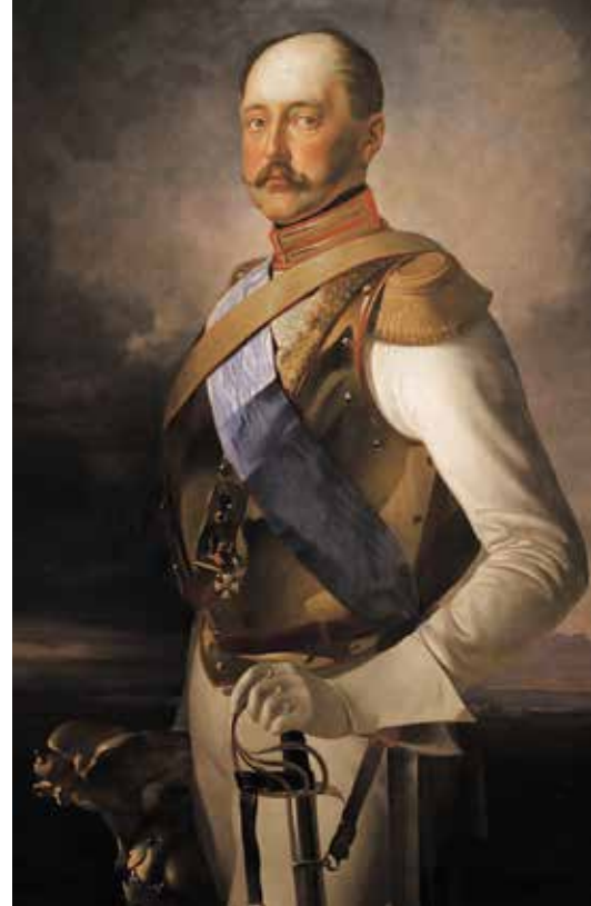
▲ Портрет Николая I работы В. Сверчкова

не только от восставших венгров, но и от «проклятых демократов». Так тогда именовались в Вене все сочувствовавшие буржуазному конституционному движению (Тарле Е. В. Крымская война: в 2-х т. – М.-Л., 1941–1944 ).