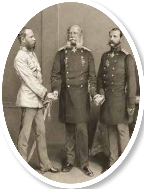
▲ Встреча Франца Иосифа I, Вильгельма I и Александра II в 1873 году

Главным же противником Германии в то время была либеральная Франция. Немецкий канцлер Бисмарк делал ставку на сотрудничество трех консервативных государств – Германии, Австро-Венгрии и России, продвигая идею «союза трех императоров» . Доверия между Венной и Петербургом, однако, по-прежнему не было.