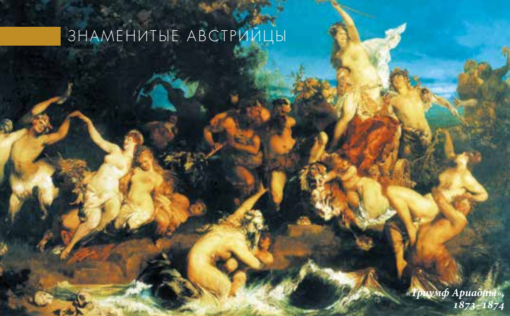
«Триумф Ариадны», 1873–1874

Он ввел моду на эклектическое оформление жилого пространства, которое стало популярным во второй половине XIX века и получило название «макартизм». Непременными аксессуарами подобных интерьеров считались огромные букеты искусственных цветов (так называемые букеты Макарта), пальмы в кадках, тяжелые драпировки, плюшевые занавеси, вносившие «элемент таинственности»,