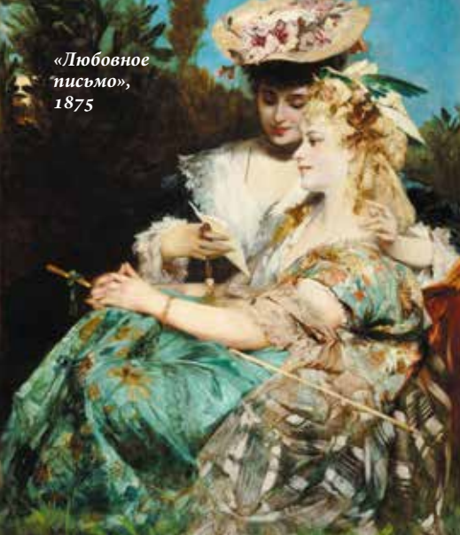
«Любовное письмо», 1875