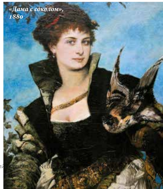
«Леди с соколом», 1880