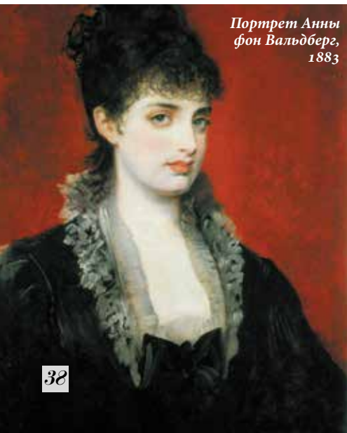
Портрет Анны фон Вальдберг, 1883