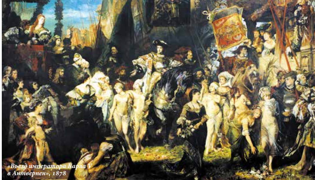
«Въезд императора Карла V в Антверпен», 1878

куда и был зачислен. Однако проучился он там всего несколько месяцев. Историки пишут, что Макарт был плохим рисовальщиком, его педагоги считали, что в юности художник был лишен таланта.