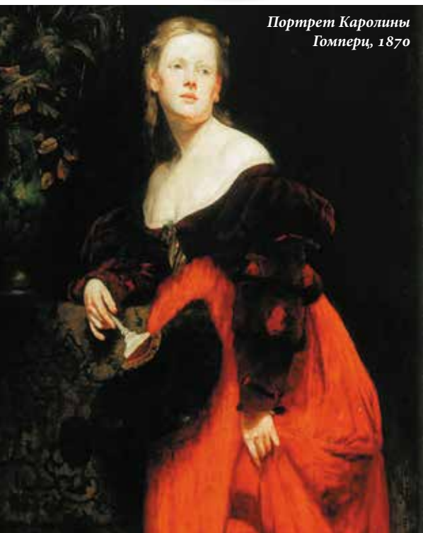
Портрет Каролины Гомперц, 1870

ХАНС МАКАРТ СЧИТАЛСЯ ГЛАВНЫМ ВЕНСКИМ ХУДОЖНИКОМ 1870–1880-Х ГОДОВ, КОТОРОГО СРАВНИВАЛИ С РУБЕНСОМ. ОН И СТАРАЛСЯ БЫТЬ РУБЕНСОМ: СТАЛ СВЕТСКИМ ЛЬВОМ, СОБЛАЗНЯЛ ЗАКАЗЧИКОВ МЯГКОЙ ЭРОТИКОЙ СВОИХ ПОЛОТЕН И ПО ПРАЗДНИКАМ ДАЖЕ НАРЯЖАЛСЯ РУБЕНСОМ.