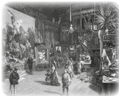
▼ В ателье Макарта, 1875

В 1868 году написал трилогию «Амуры новейшего времени», которая привлекла особое внимание ценителей живописи, и три блестящие по краскам и чрезвычайно